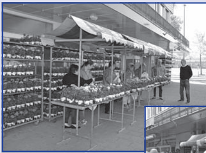
Het zeer succesvolle Geraniumfeest waar gratis geraniums aan de inwoners van Zuidwijk werden uitgedeeld