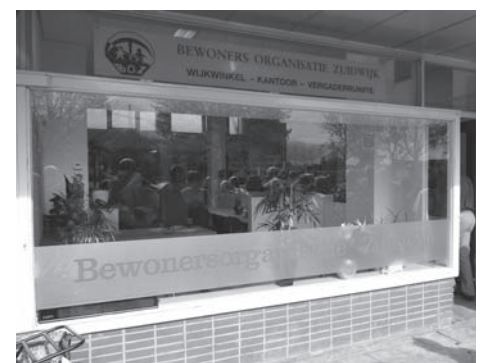
Vanaf 2012 op de Vaerhorst