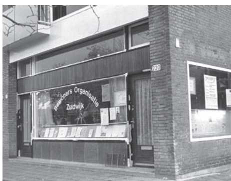
De eerste wijkwinkel aan de Schere

Met al deze activiteiten waren we zichtbaar in de wijk, maar achter de schermen werd er ook flink gewerkt, door deel te nemen aan diverse overleggen en klankbordgroepen. Denk b.v. aan het maken van plannen voor sloop, nieuwbouw en renovatie. We zaten aan tafel met de gemeente, Stichting Tuinstad Zuidwijk, later Vestia, met aannemers, architecten en aanverwante diensten. Eerste palen van nieuwbouw werden door vrijwilligers van de BOZ geslagen en bij renovatie hielden we altijd een oogje in het zeil en werd er, waar nodig, stevig onderhandeld. In de Landelijke Huurdersraad van Vestia is al jaren een vrijwilliger vanuit de