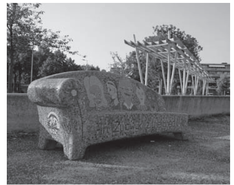
Een blijvend aandenken aan de BOZ: de Social Sofa in het Van Tijenplantsoen

Nadat in 2012 de ondersteuning van het gesubsidieerde opbouwwerk vanuit de Gemeente stopte, hebben we, als vrijwilligers, onze schouders eronder gezet en zijn zelf verder gegaan. Dat was soms moeilijk omdat je toch experts nodig hebt om mensen te motiveren en enthousiast te maken voor hun wijk. We hebben dit in onze ogen toch aardig volgehouden. Om onze vrijwilligers te bedanken, die soms jarenlang van de partij waren, maakten we diverse jaren een uitstapje of we gingen uit eten. Aan het eind van het jaar volgde dan onze traditionele kerstborrel, voor onze mensen en relaties.