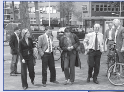
Toenmalig minister Vogelaar noemde Zuidwijk bij haar bezoek een "prachtwijk"