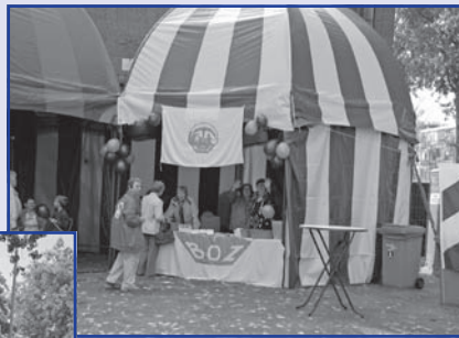
Het meerdaagse Zuidwijkspektakel ...