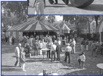
... met een optreden van Lee Towers!