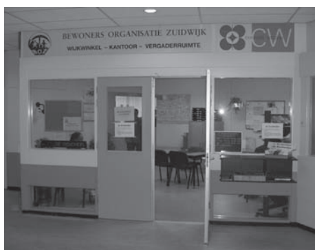
Daarna in de Larenkamp